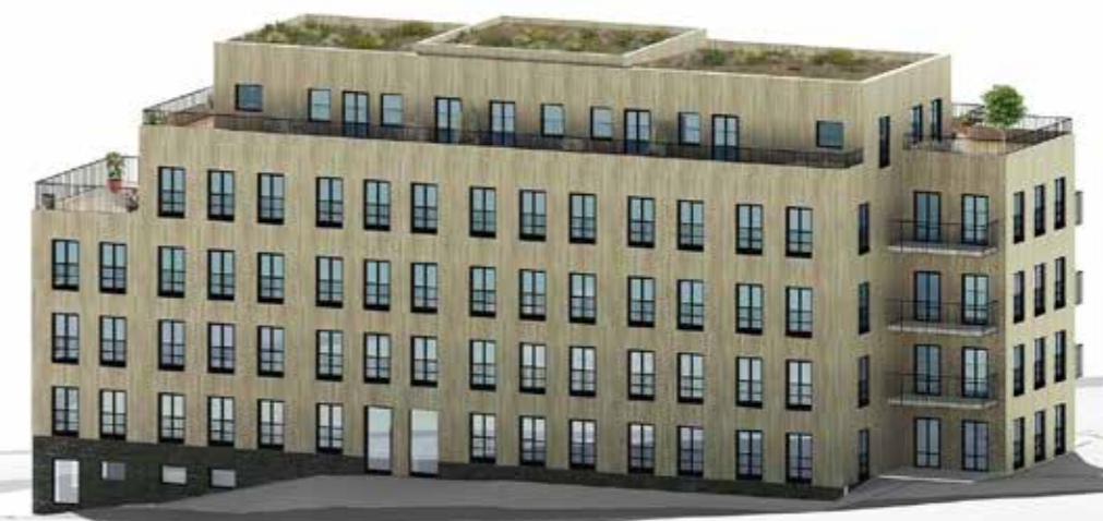
Vy från Bäckvägen