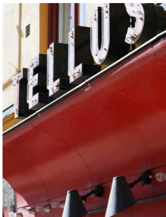
@ Tellus Bio