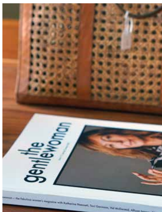
@ Andra våningen