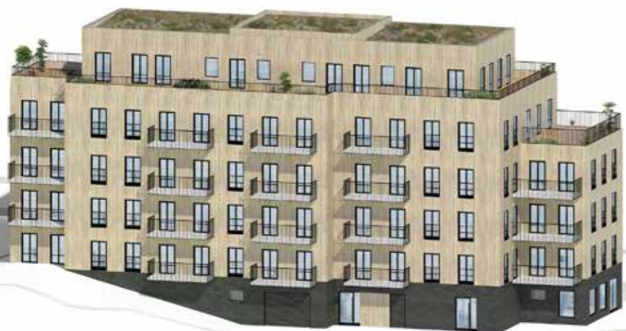
Vy från Cedergrensvägen

Alla lägenheter har fransk balkong och flertalet av lägenheterna får stora balkonger i härliga sollägen. Högst upp i byggnaden får lägenheterna terrasser som sträcker sig längs hela fasaden.