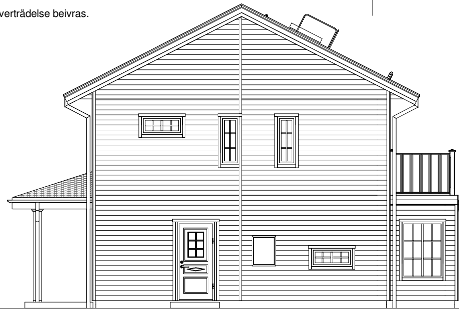
FASAD MOT NORDÖST

Denna ritning tillhör Myresjöhus. Den får ej användas av tredje person. Överträdelse beivras.