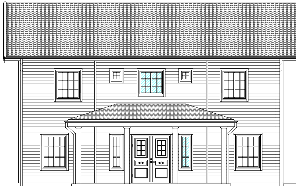
FASAD MOT SYDOST

Denna ritning tillhör Myresjöhus. Den får ej användas av tredje person. Överträdelse beivras.